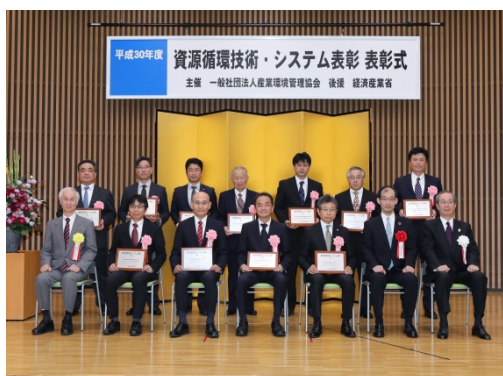
2018年10月11日 於 機械振興会館ホール

*一般社団法人産業環境管理協会が経済産業省の後援の下、昭和50年に設立され、廃棄物の発生抑制・使用済み物品の再使用・再生資源の有効利用に寄与し、高度な技術又は先進的なシステムの特徴を有する優れた事業や取組を表彰し、その事業の奨励・普及を図ることにより、循環ビジネスを振興することを目的としている。