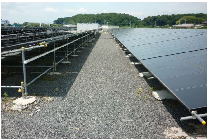
太陽光パネル防草敷均し材